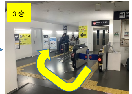
개찰구를 나와서 U 턴합니다.

2. 엘리베이터를 이용하여 JR 선 남쪽 출구 방향(2 층) 또는 도영 지하철 북쪽 출구 방향(1 층)으로 이동합니다.