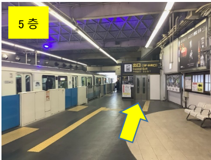
승강장 중앙의 엘리베이터를 이용하여 3 층으로 갑니다.

1. 하마마츠초역 하차 승강장(5 층)에 도착하면, 엘리베이터를 이용하여 중앙 출구(3 층)로 이동한 후, 개찰구를 나옵니다.