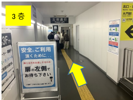
엘리베이터를 이용하여 2 층(JR 선 남쪽 출구 방향) 또는 1 층(도영 지하철 북쪽 출구 방향)으로 갑니다.

2. 엘리베이터를 이용하여 JR 선 남쪽 출구 방향(2 층) 또는 도영 지하철 북쪽 출구 방향(1 층)으로 이동합니다.