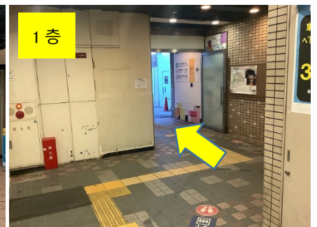
통로를 약 50m 정도 진행한 후, 도영 지하철 북쪽 출구 방향으로 갑니다.