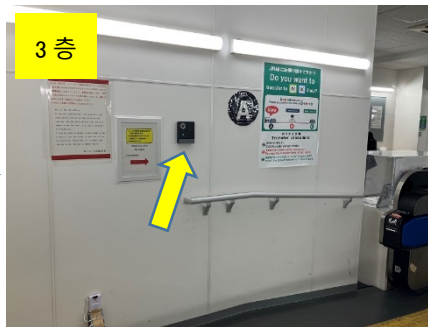
인터폰을 눌러 모바일 티켓을 직원에게 제시합니다.