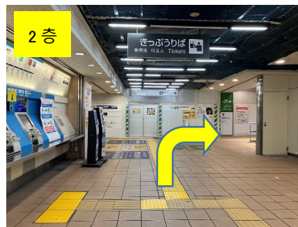
오른쪽 계단 또는 에스컬레이터를 이용하여 3 층(JR 선 남쪽 출구 방향)으로 갑니다.