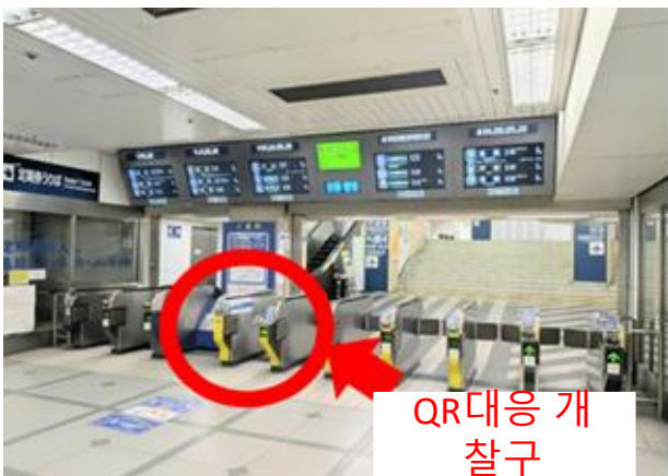
메이테츠 나고야역 중앙 개찰구