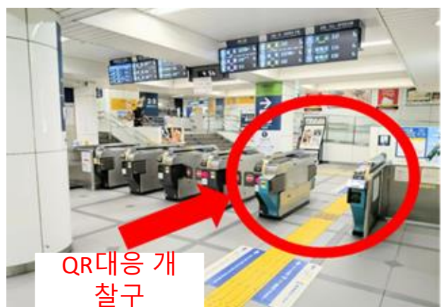
메이테츠 나고야역 서쪽 출구 개찰구